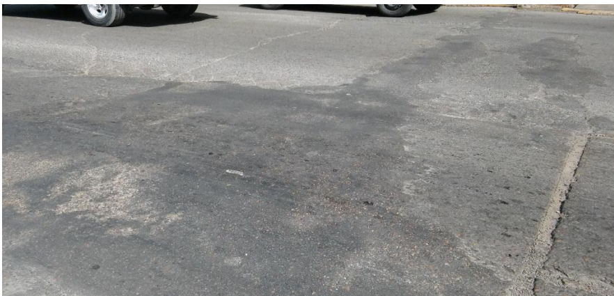
Foto: Deterioros actuales en Av. Costanera