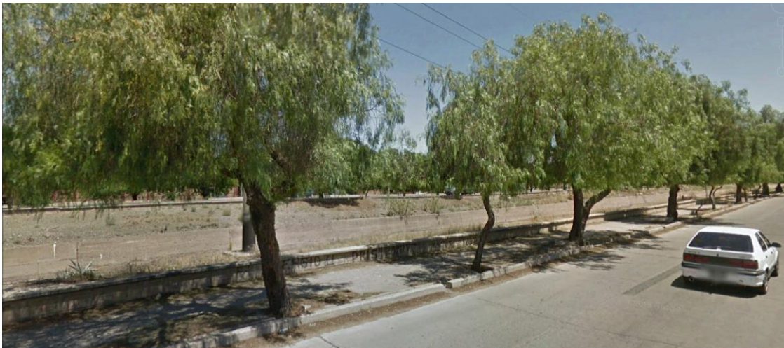
Foto: Imagen deteriorada del espacio público