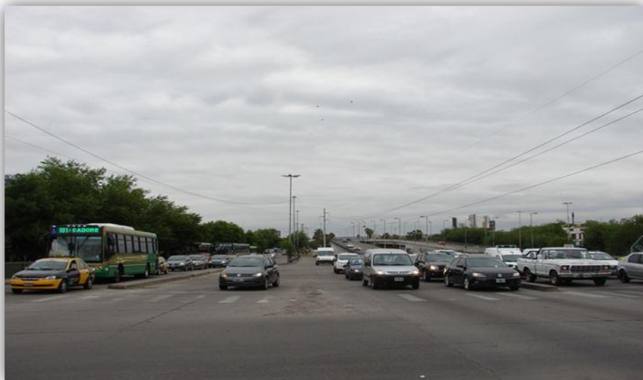
Foto: Congestión vehicular en Av. Costanera

OBRA: REFUNCIONALIZACIÓN AVDA. COSTANERA TRAMO: CALLE MATHUS HOYOS (ROTONDA DEL AVIÓN) – CALLE BRASIL DPTOS.: CAPITAL – GUAYMALLÉN – LAS HERAS - PROVINCIA DE MENDOZA