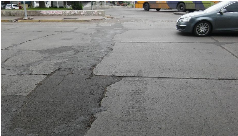
Foto: Deterioros actuales en Av. Costanera

Los problemas de carácter formal, se presentan asociados a la imagen negativa del espacio público y su entorno urbano en el acceso a Mendoza. Siendo la Costanera la única vía de acceso desde el Norte a la Provincia, presenta una estética paisajística deteriorada, que no responde a los estándares actuales.