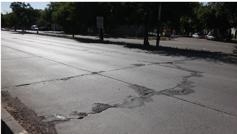
Foto: Deterioros actuales en Av. Costanera

OBRA: REFUNCIONALIZACIÓN AVDA. COSTANERA TRAMO: CALLE MATHUS HOYOS (ROTONDA DEL AVIÓN) – CALLE BRASIL DPTOS.: CAPITAL – GUAYMALLÉN – LAS HERAS - PROVINCIA DE MENDOZA